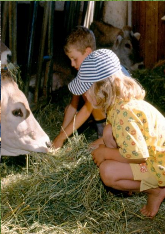
Bildung für nachhaltige Entwicklung