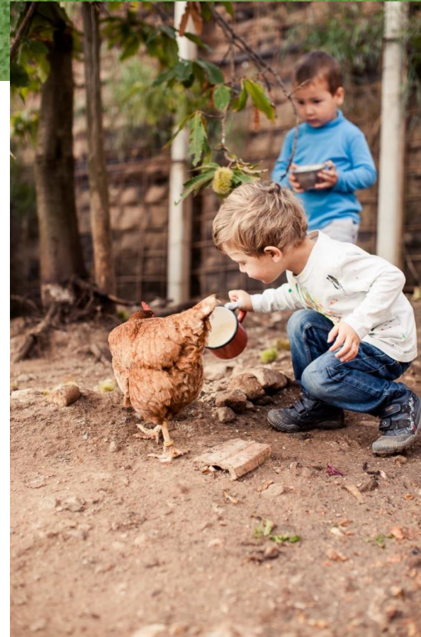
Betreuung von Kindern und älteren Menschen